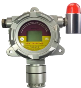
在线式气体检测仪